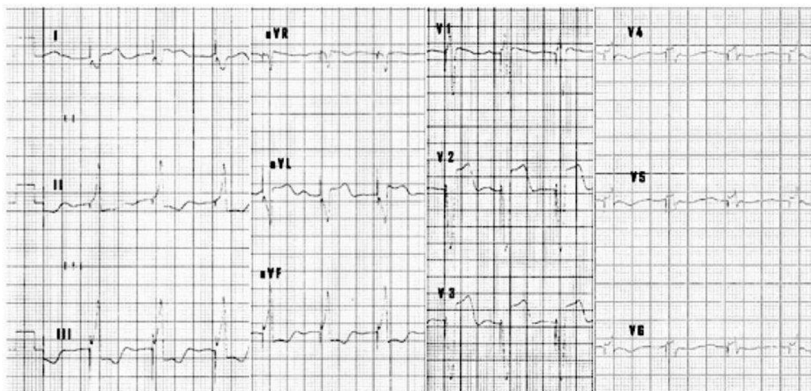
Gambar 3. Rekaman EKG 12 sandapan pasca pemasangan PJM.

ini merupakan posisi yang baik bagi pemacuan RVOT. Pandangan anteroposterior memperlihatkan posisi lead dan generator pacu jantung setelah tindakan selesai. EKG 12 sadapan menunjukkan RV captured dengan lebar QRS 158 ms dan axis inferior (Gambar 3).